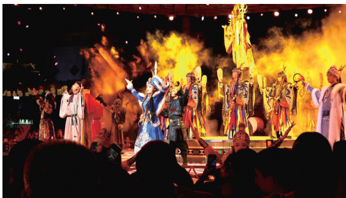
游客有序观看演出。

“五一”假期，漫葡·看见贺兰沉浸式演艺小镇3.0版本凭借沉浸式体验，迎来客流高峰，即便游人如织，文明旅