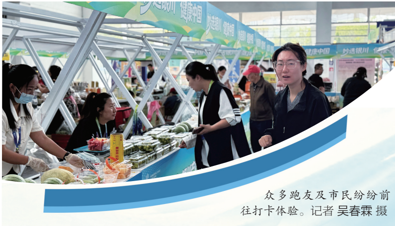
众多跑友及市民纷纷前往打卡体验。

本报讯(记者 吴春霖)5月14日，2026银马体育消费季活动在银川市国际会展中心火热启幕，活动以全方位、一站式服务，为银马提前预热，吸引众多跑友及市民纷纷前往打卡体验。本次活动为期3天，以“乐购银马，悦享消费”为主题，构建起融合体育赛事、商业展销、文化体验、旅游推介及特色产业的综合消费场景。