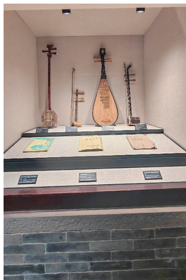
陕北民歌常用乐器。

走出博物馆，耳畔仿佛仍然回荡着悠扬的民歌。这座藏在榆林的文化地标，不仅是陕北民歌的记忆容器，更是黄土文化的精神家园。它以器物载史，以歌声传情，让千年民歌在新时代继续流淌，让黄土地的文化根脉，生生不息、代代相传。