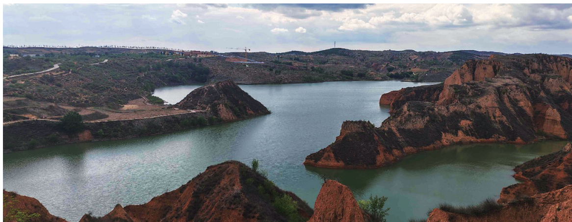
麻黄梁黄土地质公园。

这场旅行，在丹霞与黄土间穿行，看尽了塞上大地的壮阔景致，读懂了大地变迁的岁月故事。榆林的自然之美，是大气磅礴的，是质朴厚重的，它用赤焰丹霞与苍茫黄土，书写着陕北独有的自然传奇，也让每一位到访者，都深深沉醉于这片辽阔土地的独特魅力。