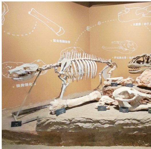
博物馆展出的古生物化石。

此行途经两处极具代表性的地质景观——靖边波浪谷与麻黄梁黄土地质公园，非常值得一看。前者是红砂岩雕琢出的地质奇迹，后者是黄土高原的缩影，一红一黄，勾勒出陕北大地最具辨识度的自然轮廓。没有刻意赶行程，伴着沿途的塞上风光缓缓前行，心境也变得格外平和，沉浸式感受大自然的鬼斧神工。