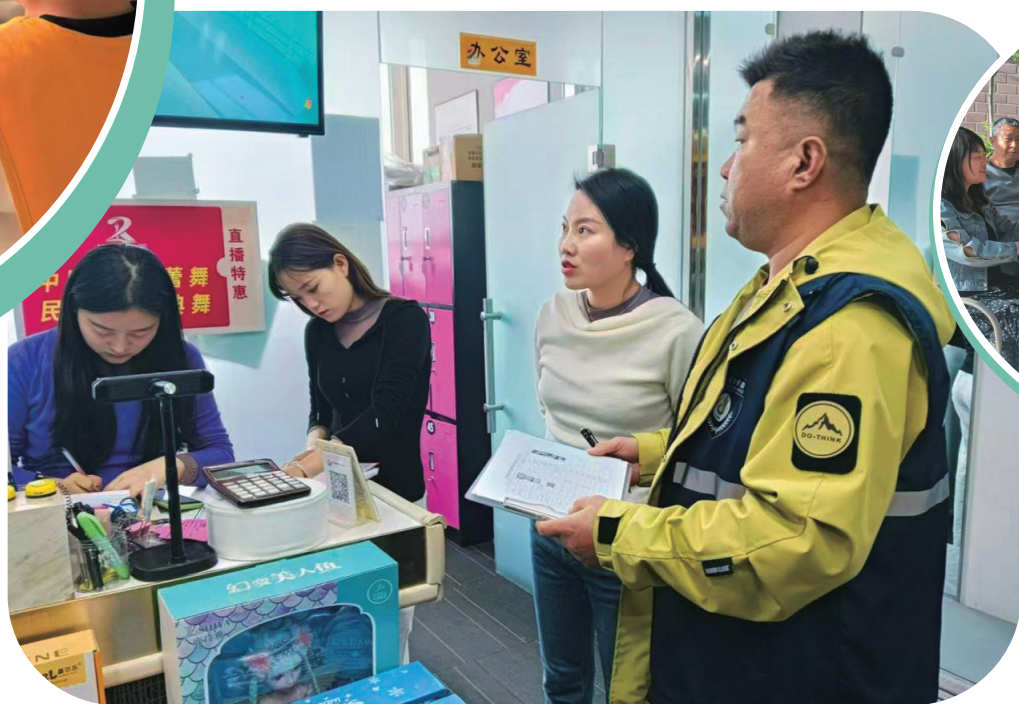
诚信经营“敲门店”，外卖小哥当“哨兵”。