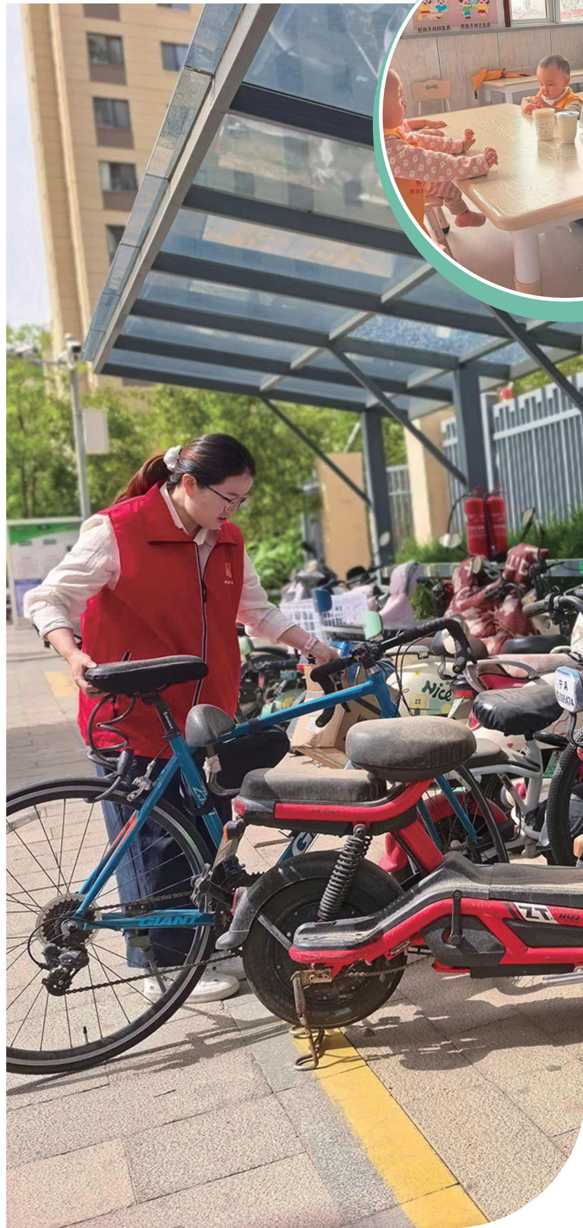
“青春有你”志愿服务队，用“小事”诠释文明温度。