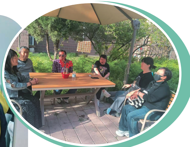
“小王唠嗑屋”里话家常。

新时代的城市治理，其核心要义在于“治事”更“治心”，“塑形”更“铸魂”。它是一场需要政府、市场、社会多方协同的“精细绣花”，也是一次旨在重新编织城市社会关系、凝聚价值共识的“文明织锦”。银川正以它的“精”与“细”，“绣”出这样的烟火，“织”就这样的底色。