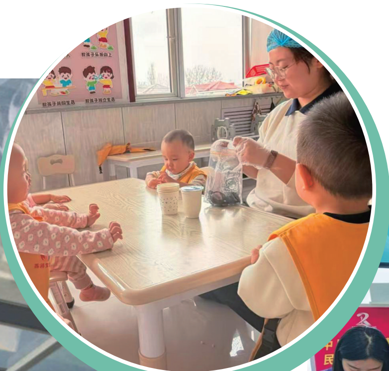
燕祥社区“宝宝屋”，带娃难题有解了。