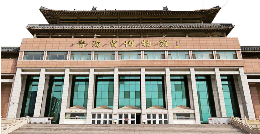
青海省博物馆。资料图片

从远古彩陶烟火，到丝路交融风华，从鲜活非遗民俗，到百年热血征程，青海省博物馆用一件件文物，讲述着高原大地的沧桑与璀璨。