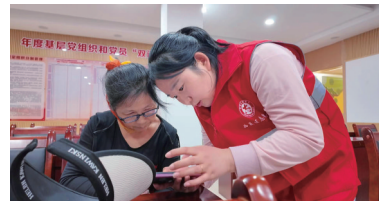
助老人跨越“数字鸿沟”。

智能手机已渗透到日常生活的方方面面——看病挂号、买菜付款、缴纳水电费、养老金认证,动动手指就能办妥。但对不少老年人来说,这块小屏幕却像一道难以跨越的