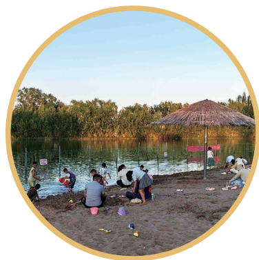
孩子们在沙滩玩耍。